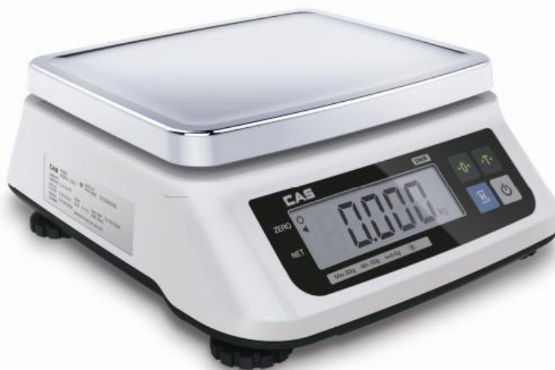
Рисунок 1 - Общий вид весов

Общий вид весов представлен на рисунке 1.